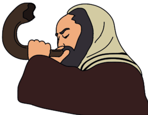
המשך בעמוד הבא